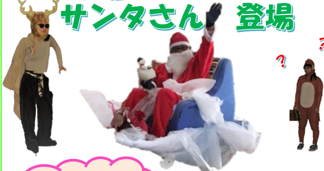
サンタさんと 記念撮影