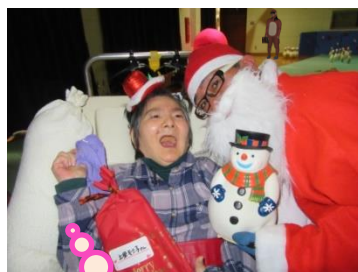
プレゼント もらったよ♪