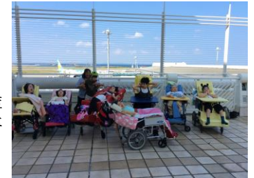
◎校外学習「那覇空港見学」

新入生を迎える会、校外学習、買い物学習、水遊び、交流学习、鑑賞会、お楽しみ会、卒業生を送る会等。