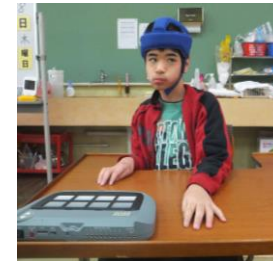
◎スイッチ教材を使った学習