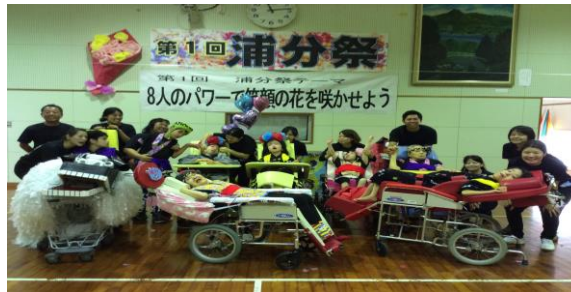
学校行事 ◎第1回 浦分祭