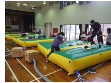
◎エアートランポリン